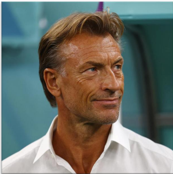
M. Hervé RENARD

Homme de terrain, de cœur et de principes, il incarne un football exigeant mais profondément humain. Son parcours unique, marqué par des victoires historiques sur le continent africain, rejoint naturellement les valeurs de notre association : Transmission, respect et solidarité.