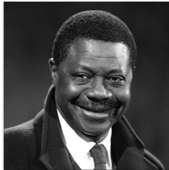
M. Pape DIOUF (1951-2020)

Il connaissait bien Pape DIOUF, notre parrain d'honneur à jamais, avec qui il partageait une profonde estime mutuelle. C'est donc avec une symbolique forte et une continuité pleine de sens qu'il accepte aujourd'hui de prendre la relève en tant que parrain.