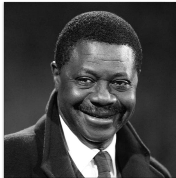
M. Pape DIOUF (1951-2020)

Il connaissait bien Pape DIOUF, notre parrain d'honneur à jamais, avec qui il partageait une profonde estime mutuelle. C'est donc avec une symbolique forte et une continuité pleine de sens qu'il accepte aujourd'hui de prendre la relève en tant que parrain.