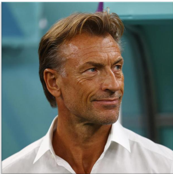
M. Hervé RENARD

Homme de terrain, de cœur et de principes, il incarne un football exigeant mais profondément humain. Son parcours unique, marqué par des victoires historiques sur le continent africain, rejoint naturellement les valeurs de notre association : Transmission, respect et solidarité.